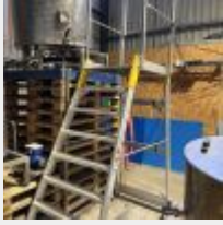
Lot n° 6 Escabeau roulant sécurisé FORTE ALVE Mise à prix : 200 €