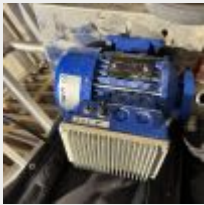
Lot n° 8 Pompe LIVERANI MINIVERTER, sur petit chariot inox Mise à prix : 50 €