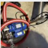
Lot n° 10 Pompe LIVERANI Midex sur petit chariot inox Mise à prix : 50 €