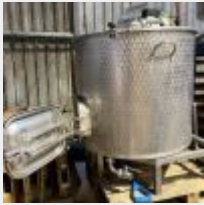
Lot n° 7 Cuve de filtration POLSINELLI 500L avec couteaux reliés à l'agitateur, fond filtrant, trou d'homme rectangulaire (pelle) Mise à prix : 300 €