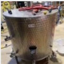
Lot n° 9 2 Cuves d'ébullition inox (1 de 500L et 1 de 300 L), avec 2 supports inox et 2 brûleurs à gaz Mise à prix : 600 €