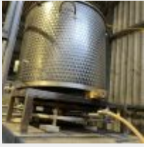
Lot n° 5 Cuve d'empâtage POLSINELLI avec aspirateur motorisé et un brûleur à gaz Mise à prix : 300 €