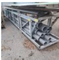
Lot n° 133