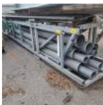
Lot n° 134