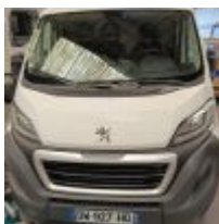
Lot n° 131