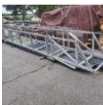
Lot n° 135