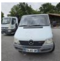
Lot n° 130