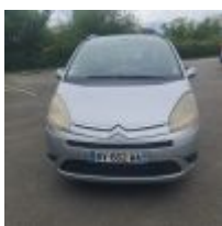
Lot n° 20 CITROEN C4 GD HDI