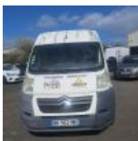
Lot n° 12.1 CITROEN JUMPER 2.2 HDI