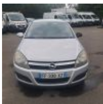
Lot n° 19 OPEL ASTRA 1.7 CDTI