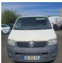
Lot n° 13 VOLKSWAGEN TRANSPORTER TDI 130 CH