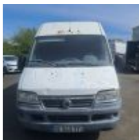
Lot n° 15 FIAT DUCATO