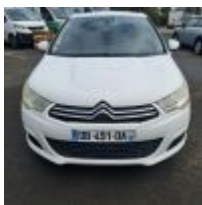
Lot n° 18 CITROEN C4 1.6 HDI