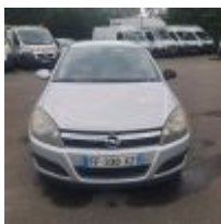
Lot n° 19 OPEL ASTRA 1.7 CDTI